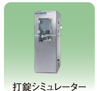
打錠シミュレーター 【Stylone Evolution】