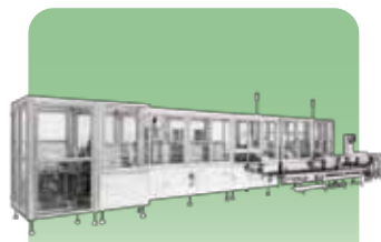
フィルム成形充填包装機 【PRESTA-LIQUID】