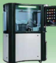
錠剤カプセル用外観検査機 【PLANET】