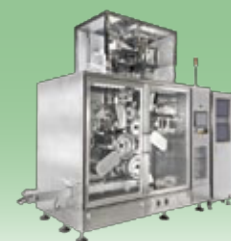
IJ方式錠剤印刷検査機 【IIM】