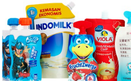
【フィルム製袋充填サンプル】