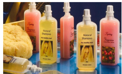
【フィルム成形充填サンプル】